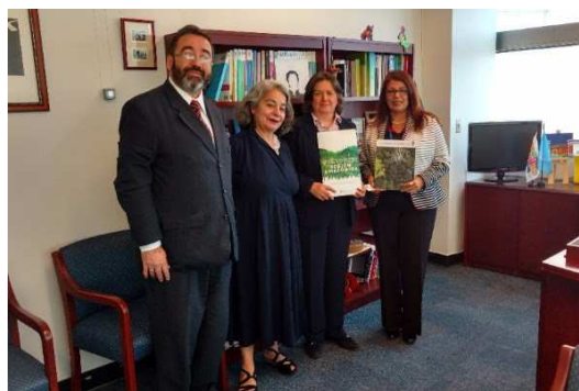
Visita al Programa de las Naciones Unidas para el Desarrollo en Nueva York

Adicionalmente a las reuniones sostenidas por la Secretaria General y el Director Ejecutivo de la SP/OTCA, tanto la Coordinación de Medio Ambiente como la del Proyecto Monitoreo hicieron lo propio delegados de los Países Miembros de la OTCA, países con interés en las actividades de la Agenda Forestal; así como con posibles cooperantes para mantener las actividades de monitoreo de la deforestación en la región amazónica.